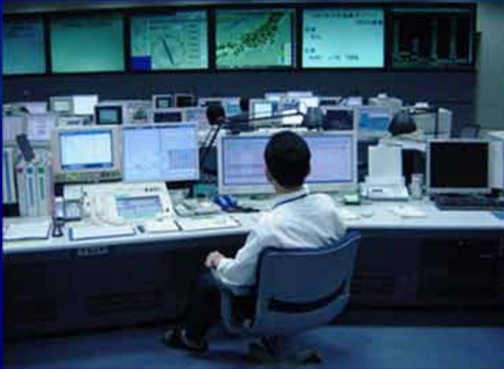
AUTOMATIZACIÓN DE LA UNIDAD DE FLUJO