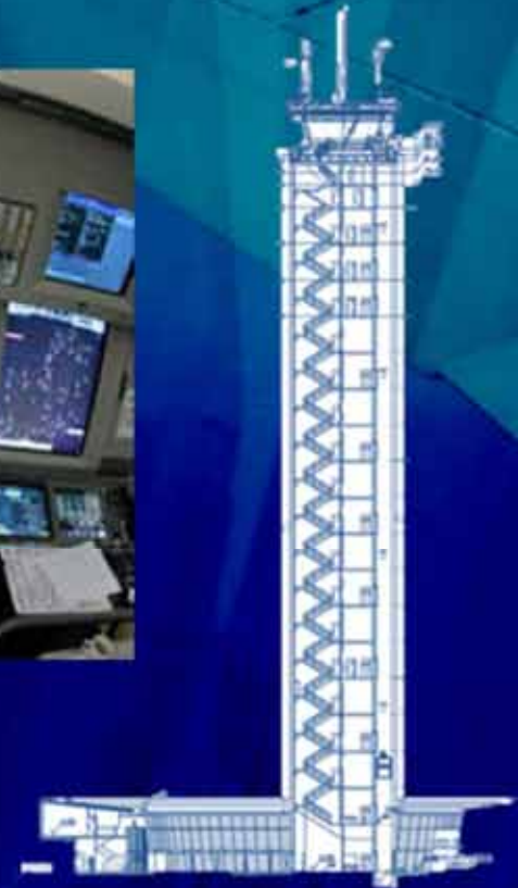
NUEVA TORRE DE CONTROL AUTOMATIZADA