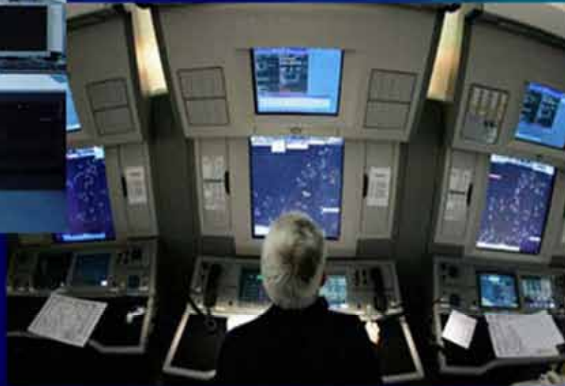
NUEVO CENTRO DE CONTROL DE BOGOTÁ Y PLATAFORMA NACIONAL